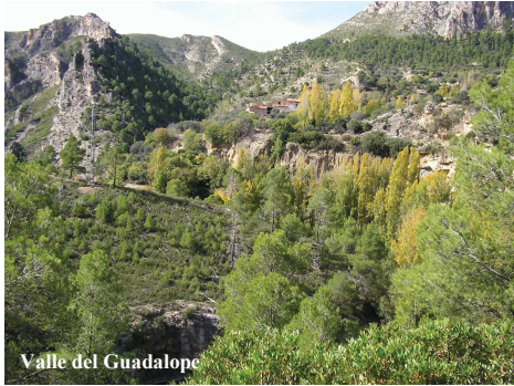
Valle del Guadalope

En esta zona se encuentra muy encajado, generando un paisaje bastante agreste. El encajamiento se vio favorecido por la existencia de un endocarsst previo, en el que por disolución de las calizas se formaron amplios conductos subterráneos, que fueron aprovechados por el río cuando la erosión dismanteló el techo de los mismos.