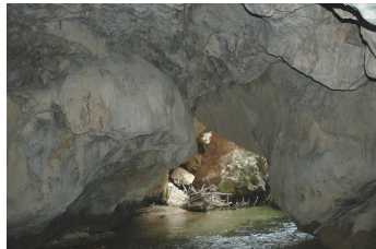
Vano del Puente de Fonseca

Excepcionalmente, si ésta ha crecido en voladizo formando una cascada y dejando un hueco a modo de cueva, el río busca su camino a través de ella, formando un túnel.