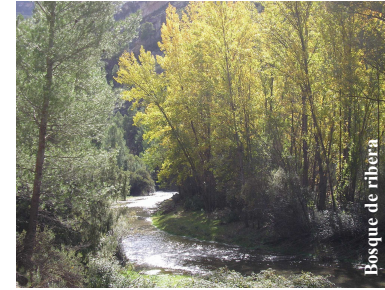
Bosque de ribera

En torno al puente natural se dan las condiciones de humedad que permiten el desarrollo de un bosque de ribera, con chopos y sauces.