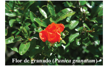
Flor de granado ( Punica granatum )

La vegetación de las laderas es típica de clima mediterráneo, y en parte es la resultante de la regeneración tras el gran incendio ocurrido en 1994. Destaca la presencia inusual de algunas especies termófilas, como el granado o el madroño.