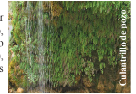
Culantrillo de pozo

Como curiosidad, mencionar la presencia de un helecho, el culantrillo de pozo ( Adiantum capillus-veneris ), en las paredes rezumantes del puente.