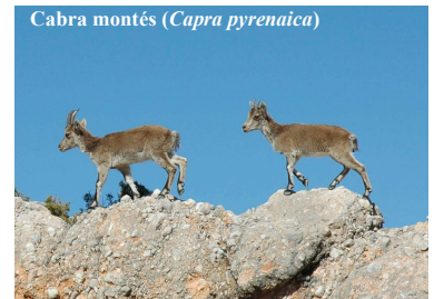
Cabra montés ( Capra pyrenaica )

Entre los mamíferos destacan el jabalí ( Sus scrofa ) y la cabra montés ( Capra pyrenaica ).