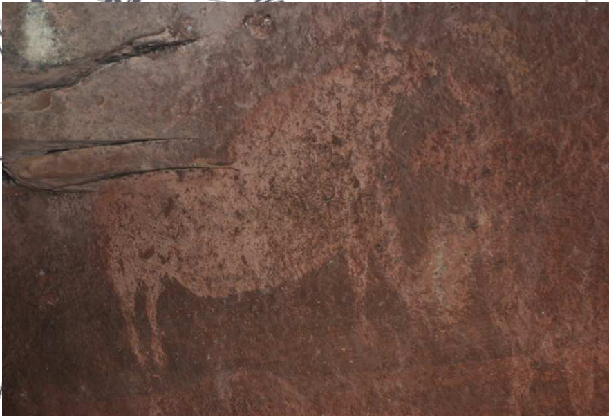
Pintura de los toros del prado del Navazo