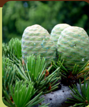
Detalle del fruto

Se trata de una conífera perennifolia que supera normalmente los 30 metros de altura. Su tronco es de gran grosor en su parte baja mientras que sus ramas superiores, más estrechas, adoptan una forma caída. De ellas se extraía su mítica madera pesada, densa, fuerte, duradera y aromática.