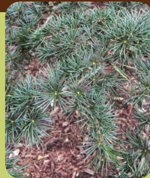
Detalle de la hoja