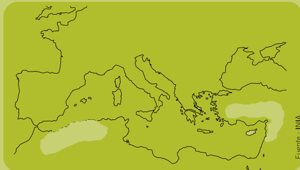
Distribución en el Mediterráneo