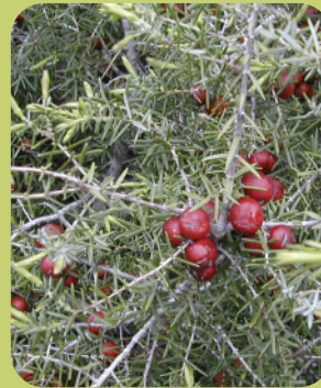
Detalle del fruto

Sus hojas brotan desde el nudo del tallo en conjuntos de tres, rígidas y punzantes, se mezclan en la copa con sus frutos de forma carnosa, a modo de baya, los cuales tienen un color verdoso al principio y posteriormente pardo-rojizo. Esta especie florece al final del invierno y durante la primavera maduran sus frutos.