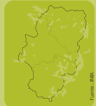
Distribución en Aragón