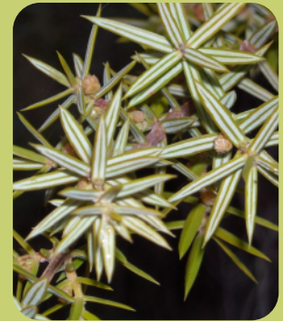
Detalle de la hoja