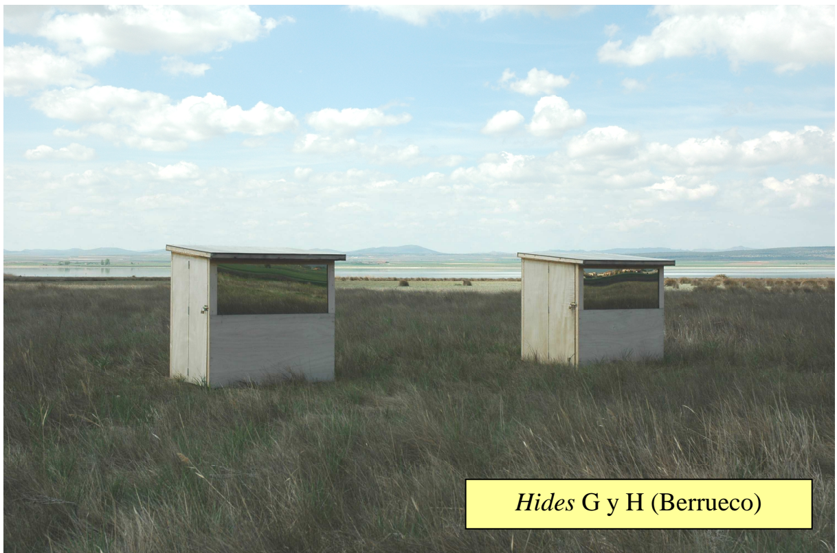
Hides G y H (Berrueco)