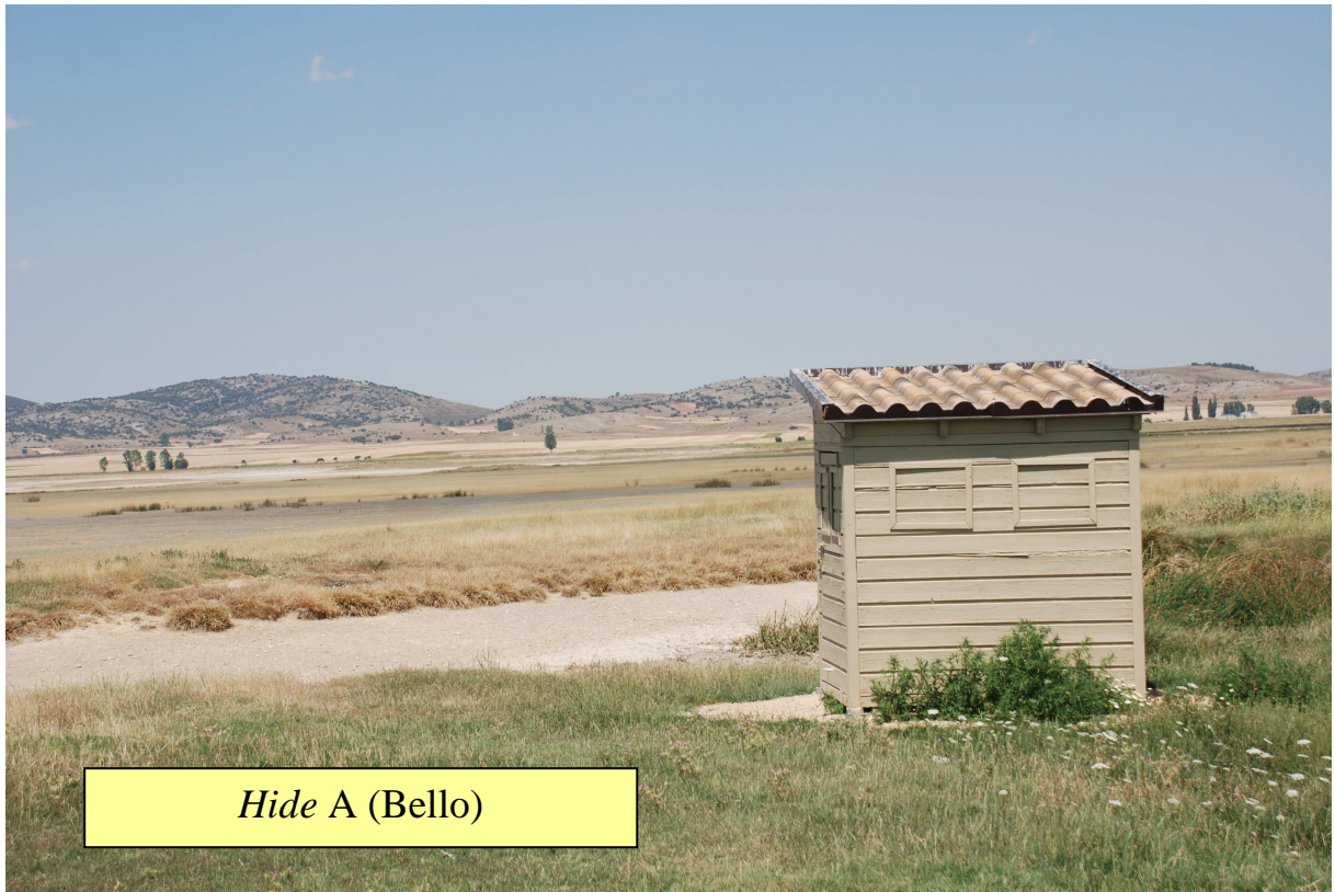
Hide A (Bello)