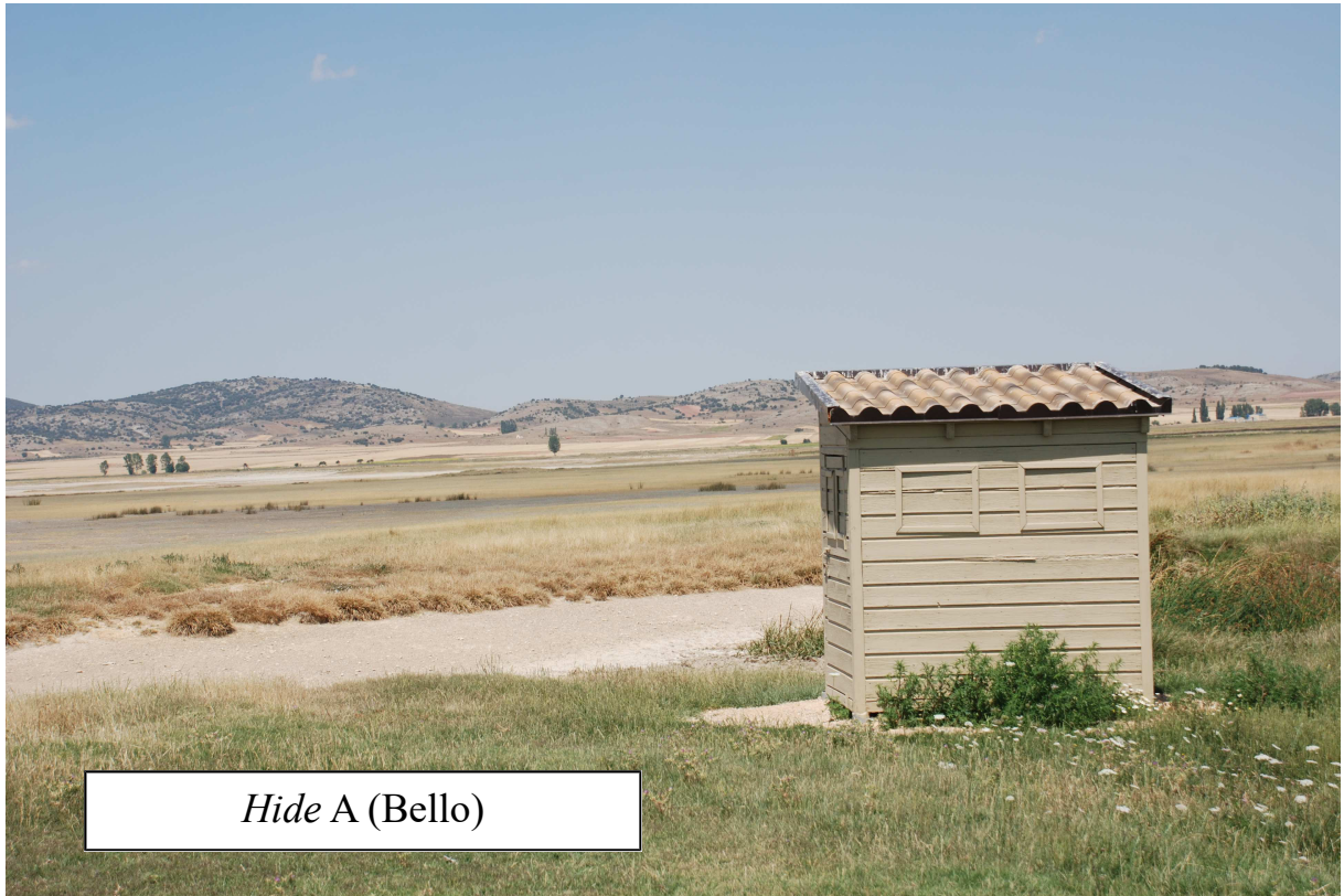
Hide A (Bello)