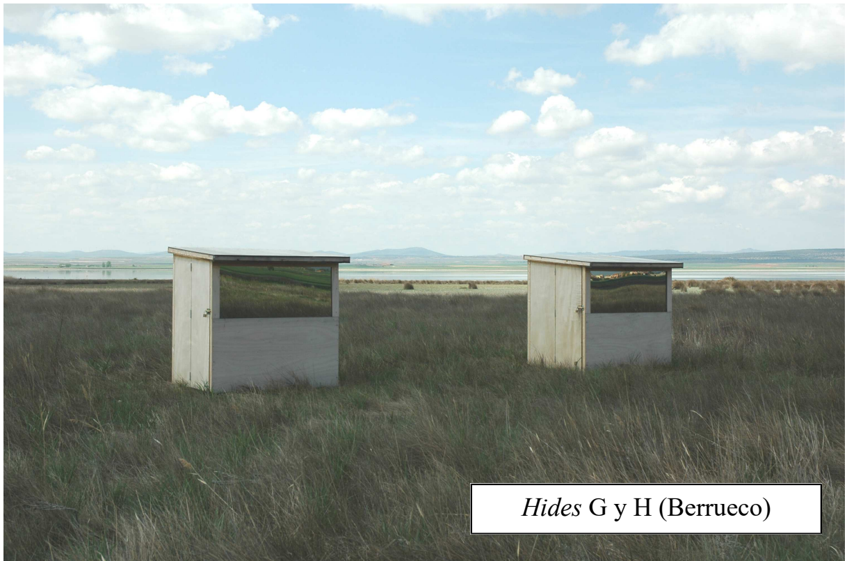
Hides G y H (Berrueco)