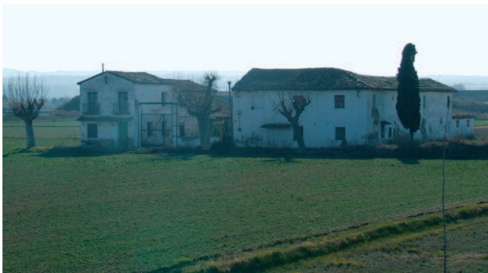
Torre del Pilar.

Los usos del regadío, los forestales y los aprovechamientos tradicionales han generado un mosaico paisajístico de gran interés ambiental.