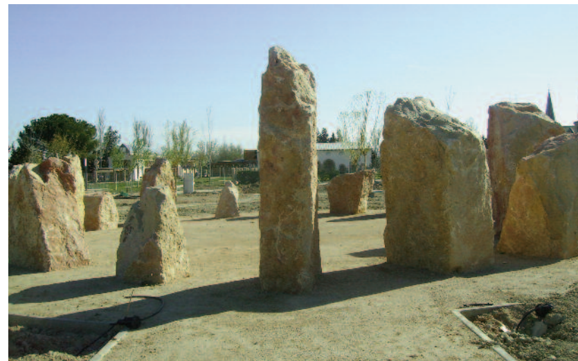
Jardín de Rocas La Alfranca.

En torno al juego de la oca, este jardín geológico es un excelente recurso educativo. Además está concebido como un espacio de encuentro entre lo material y lo espiritual, elementos que, según el saber ancestral y tradicional, componen la naturaleza del ser humano.