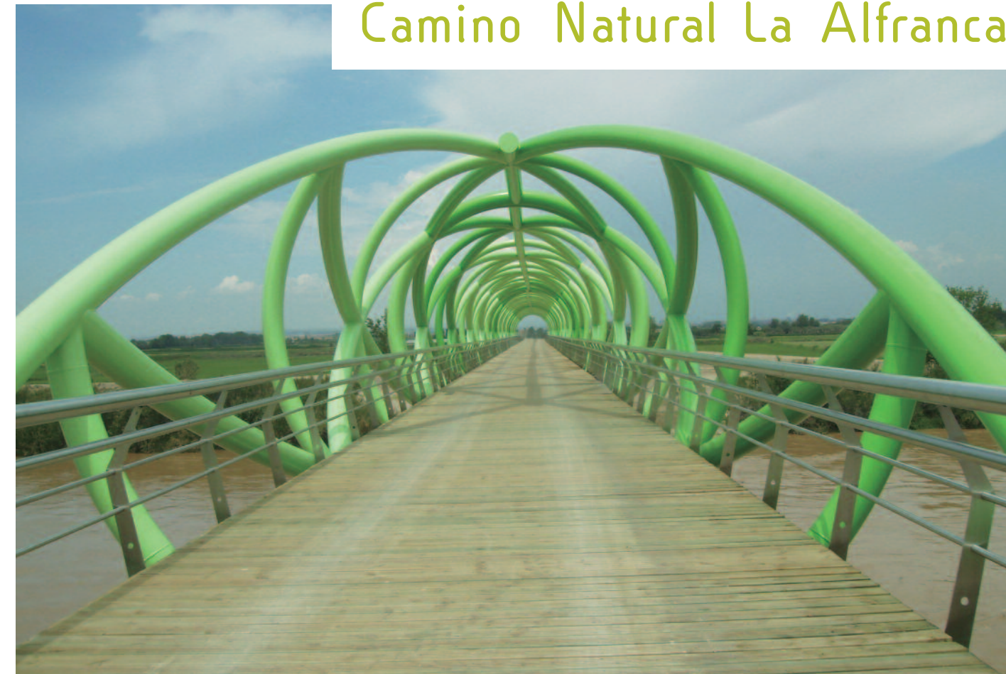
Diseño y realización SAREGA • Papel Reciclado: 100% • 2018