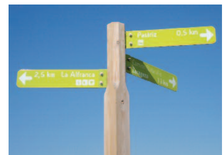
Señalización Camino Natural La Alfranca.

También encontrarás señalizaciones que te indicarán el camino a seguir.