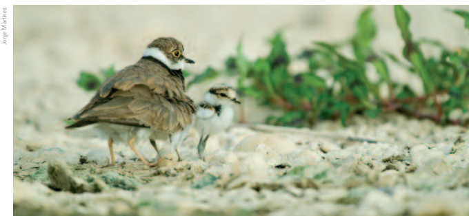
Chorlito con pollos en una playa de gravas del río.

>> Los galachos o meandros abandonados . Fruto de la intensa actividad del río, los meandros tienden a acentuarse hasta que llegan al estrangulamiento y el río toma un nuevo cauce, dejando el meandro aislado del cauce principal. Durante décadas puede mantenerse en estas zonas una lámina del agua libre debido principalmente a las infiltraciones. En este ambiente palustre, se hace protagonista el carrizo, que tiene un importante papel en la evolución ecológica de estos paisajes, pues marca el inicio de la lenta transformación de la masa de agua libre en bosque de ribera. Además constituye un importante refugio para la fauna. Merece la pena resaltar el carrizal de La Alfranca, considerado como el más extenso de Aragón.