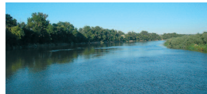
Río Ebro y bosque de ribera.

El Camino Natural La Alfranca permite al visitante apreciar como el río configura un paisaje de cambiantes meandros, islas o mejanas, playas de gravas, meandros abandonados... En este dinámico medio destacan: