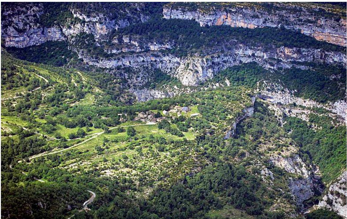
Vista área de la garganta de Escuaín, el pueblo y el cercano espolón rocoso de O'Castiello

El primer mirador nos ofrece una espectacular vista de la garganta, y encontraremos un panel informativo descriptivo de las principales aves rapaces y de las plantas rupícolas, adaptadas a desarrollarse en sus paredes verticales.