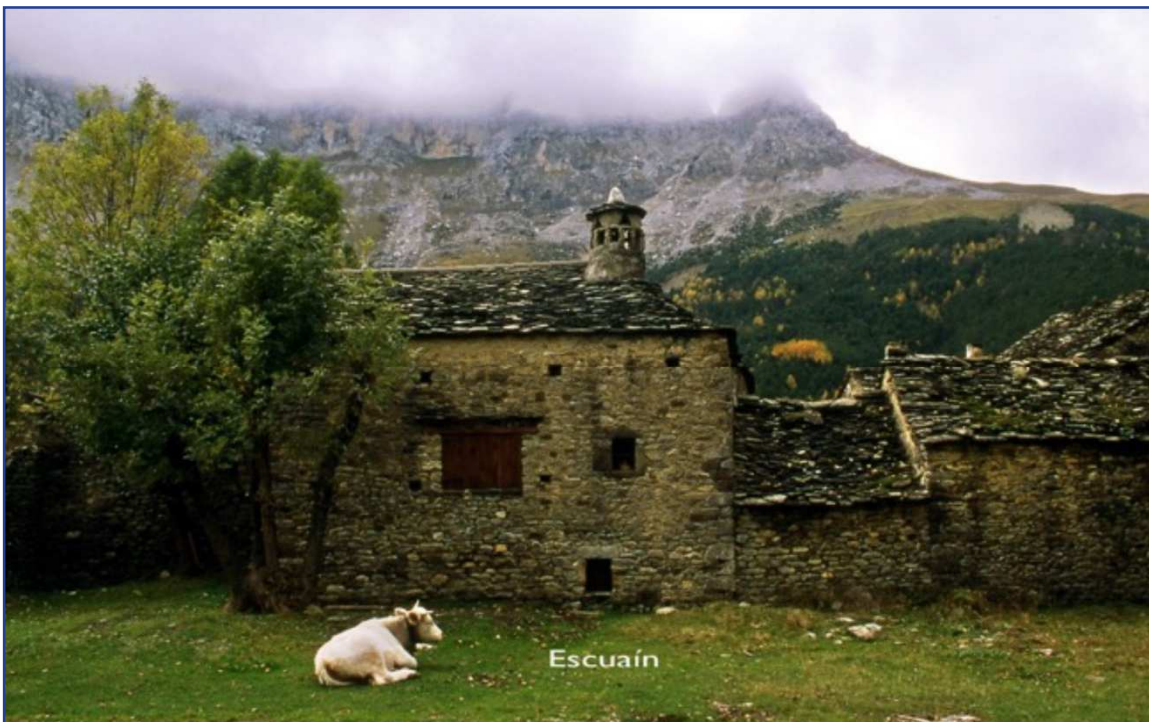
Imagen del pueblo de Escuaín

Retornamos al pueblo pasando junto a la central fotovoltaica, donde nos encontraremos de nuevo en el Punto de Información del Parque Nacional.