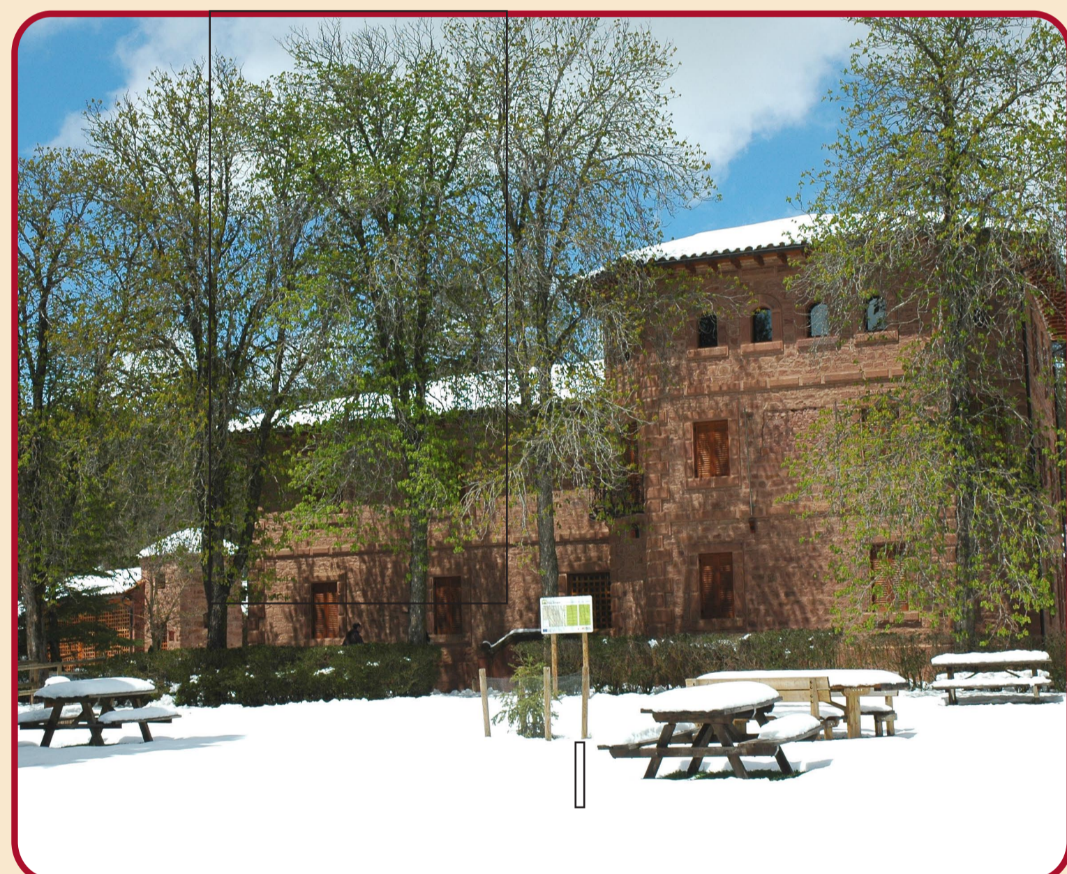
Fotografías: Belén Leránoz Centro de Interpretación de Dornaque

Recorrido: Se inicia en el Centro de Interpretación de Dornaque y discurre por pistas forestales, hasta llegar a la Laguna de Bezas, que es el mayor humedal de la Sierra de Albarracín. En la explanada de la laguna se desarrolla un bosque de sabina albar ( Juniperus thurifera ) acompañada de pino rodeno y enebros, entre otras especies. Es curioso ver ejemplares de enebro común ( Juniperus communis ) junto al enebro de la miera ( Juniperus oxycedrus ). Se continúa por una pista forestal y descendiendo llegaremos al casco urbano de Bezas. A continuación, comenzaremos un ascenso en las afueras de Bezas que nos permitirá volver a una pista forestal bajo pinar. Se serpentea bajo el pinar hasta llegar a un punto donde comienza el descenso con mayor desnivel del sendero que nos conducirá a un ancho cortafuegos, y seguidamente llegaremos al punto de partida.