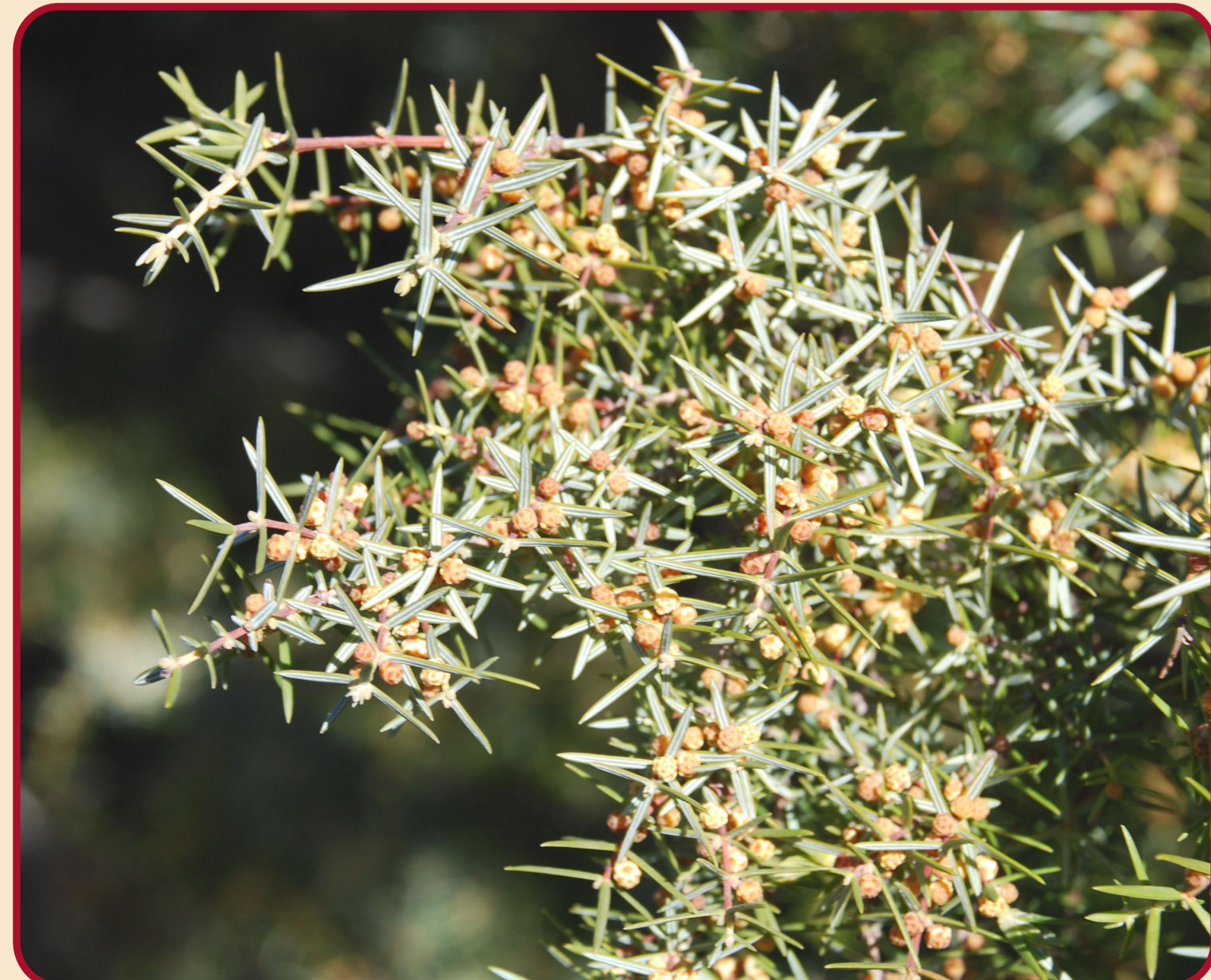
Enebro ( Juniperus oxycedrus )

Recomendaciones: Llevar calzado adecuado, agua y algo de comida.