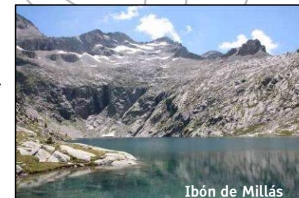
Ibón de Millás

Comienza por la GR 11 atravesando pastos de siega salpicados de bordas y cabañas ganaderas hasta que llegamos a una bifurcación donde tomaremos la senda de la derecha en descenso. Se trata del GR 11.2 que cruzar el puente sobre el río Zinqueta de Añes Cruces y remontar el barranco de la Ribereta por su margen orográfica derecha. Tras unas 2 h y 30 min de recorrido y próximos a los 2.200 m de altitud, encontraremos un cruce de caminos donde la señalización nos indica que nuestro sendero se desvía a la derecha (dejamos el GR 11.2) para alcanzar en unos 30 minutos el ibón de Millás situado a 2.353 m de altitud.