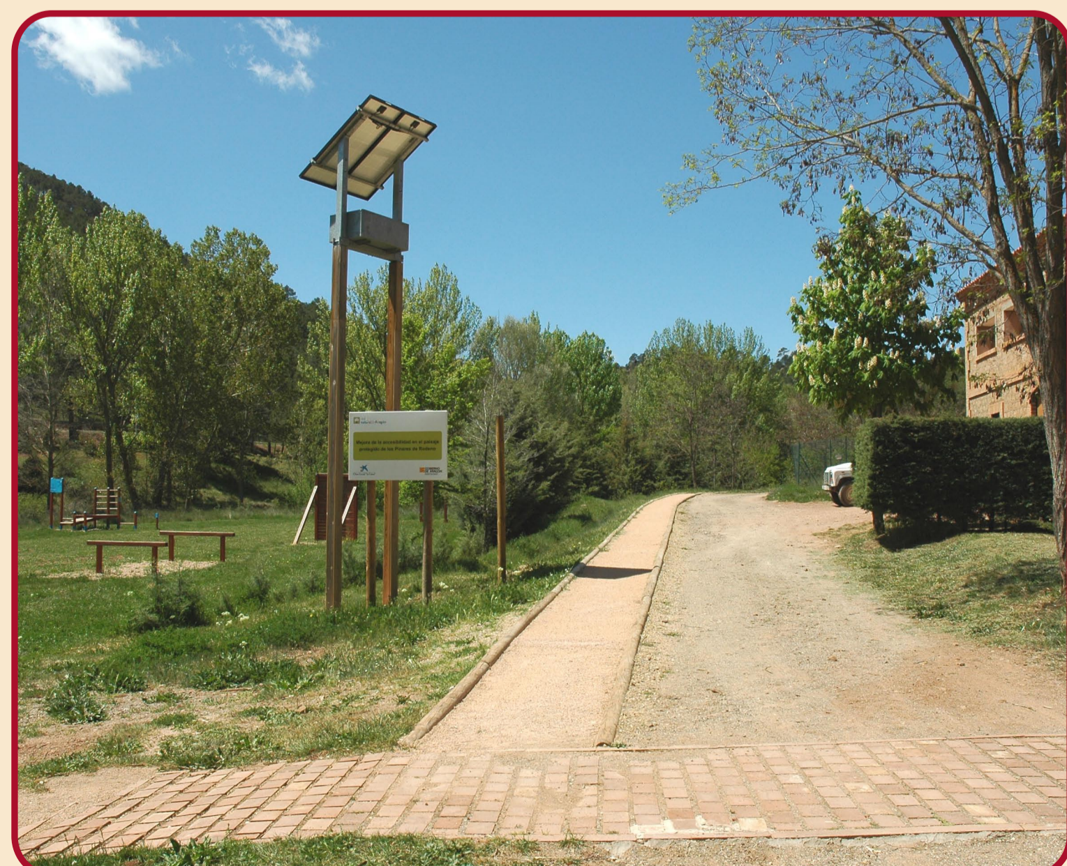
Inicio de Sendero

Centro de Interpretación de Dornaque (gratuito): Telf.: 978 68 10 72 Reserva de visitas: SARGA. Telf.: 976 40 50 41 www.rednaturaldearagon.com