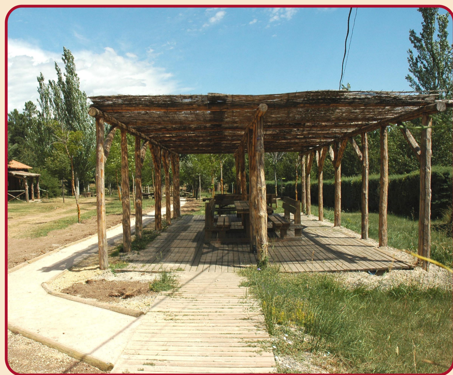
Área Recreativa de Fuente Buena

Recorrido: Lineal de 720 metros (ida) accesible a todos los visitantes, con independencia de su grado de discapacidad. El sendero se inicia en el Centro de Interpretación de Dornaque, centro adaptado que muestra los valores del Paisaje Protegido. El corto recorrido finaliza en el área recreativa de Fuente Buena, donde además de una fuente y un fogón, hay mesas y aparcamiento también accesibles a todos los visitantes. A lo largo del sendero se aprecia vegetación de ribera (chopos, sauces...) en contraste con el pino rodeno que domina el Paisaje Protegido.