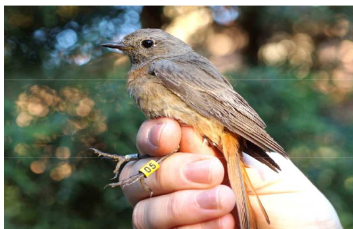
Marcaje de colirrojo real