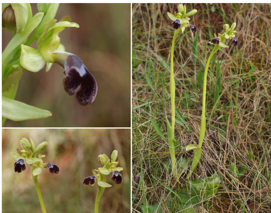
Dos pies de Ophrys dyris iniciando la floración

Este año también se estableció el protocolo para futuros seguimientos, que incluye especies raras o muy raras presentes en el PPPR en su límite de distribución, con poblaciones significativas para obtener datos fiables a medio y largo plazo, y que sean especies con morfología constante y fácilmente reconocibles en el campo. Además, se realizarán el seguimiento de varios hábitats de interés presentes en el PPPR y sus límites geográficos con elevada presencia de orquídeas.