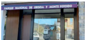
Avda. Pineta. Ed. Portal de Añisclo, 9. 22363. Escalona. Tel. 974 50 51 31

Abierto de miércoles a domingo de 9:00 a 14:00 y de 16:15 a 19:00 h.