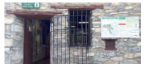
C/ Única, s/n. 22362. Escuaín. Tel. 974 94 15 60