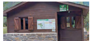
Pradera de Pineta. Inicio pista de La Larri