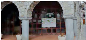
Plaza Mayor, 7. 22350. Bielsa. Tel. 974 50 10 43

Abierto todos los días en horario ininterrumpido de 8:00 a 17:00 h.