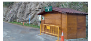
Aparcamiento de San Úrbez Cañón de Añisclo