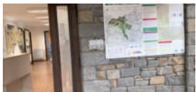
C/ Iglesia, s/n. 22375. Fanlo. Tel. 974 94 81 50