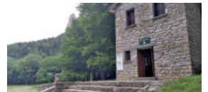
Pradera de Ordesa