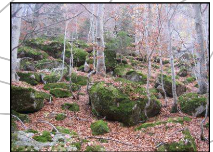
Recorrido por el hayedo en distintas épocas del año.

El camino del valle de Salenques sigue el río del mismo nombre por un bosque sombrío lleno de hayas, cuyo trazado te dará la posibilidad de ver hermosos saltos de agua, casi desde su afloramiento. El jabalí, el corzo y el zorro son los mamíferos más fácilmente visibles. La trucha común comparte su hábitat con el tritón pirenaico.