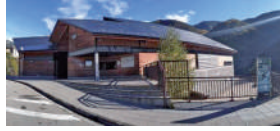
Avda. Ordesa s/n. 22376. Torla-Ordesa. Tel. 974 48 64 72

Abierto todos los días en horario ininterrumpido de 9:00 a 15:30 h.