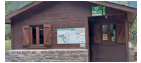
Pradera de Pineta. Inicio pista de La Larri