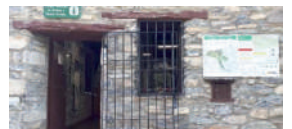
C/ Única, s/n. 22362. Escuaín. Tel. 974 94 15 60

Abierto todos los días en horario ininterrumpido de 9:00 a 18:00 h.