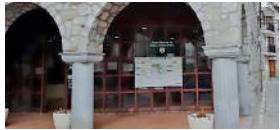
Plaza Mayor, 7. 22350. Bielsa. Tel. 974 50 10 43

Abierto todos los días en horario ininterrumpido de 9:00 a 15:30 h.