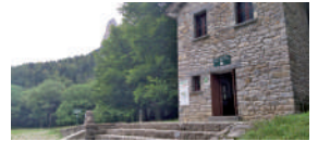
Pradera de Ordesa