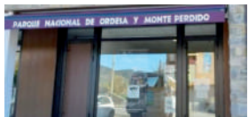
Avda. Pineta. Ed. Portal de Añisclo, 9. 22363. Escalona. Tel. 974 50 51 31

Abierto viernes, sábados y domingos (V a D) de 9:00 a 14:00 y de 15:15 a 18:00 h.